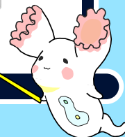
微生物キャラクター ヒルガタワムちゃん