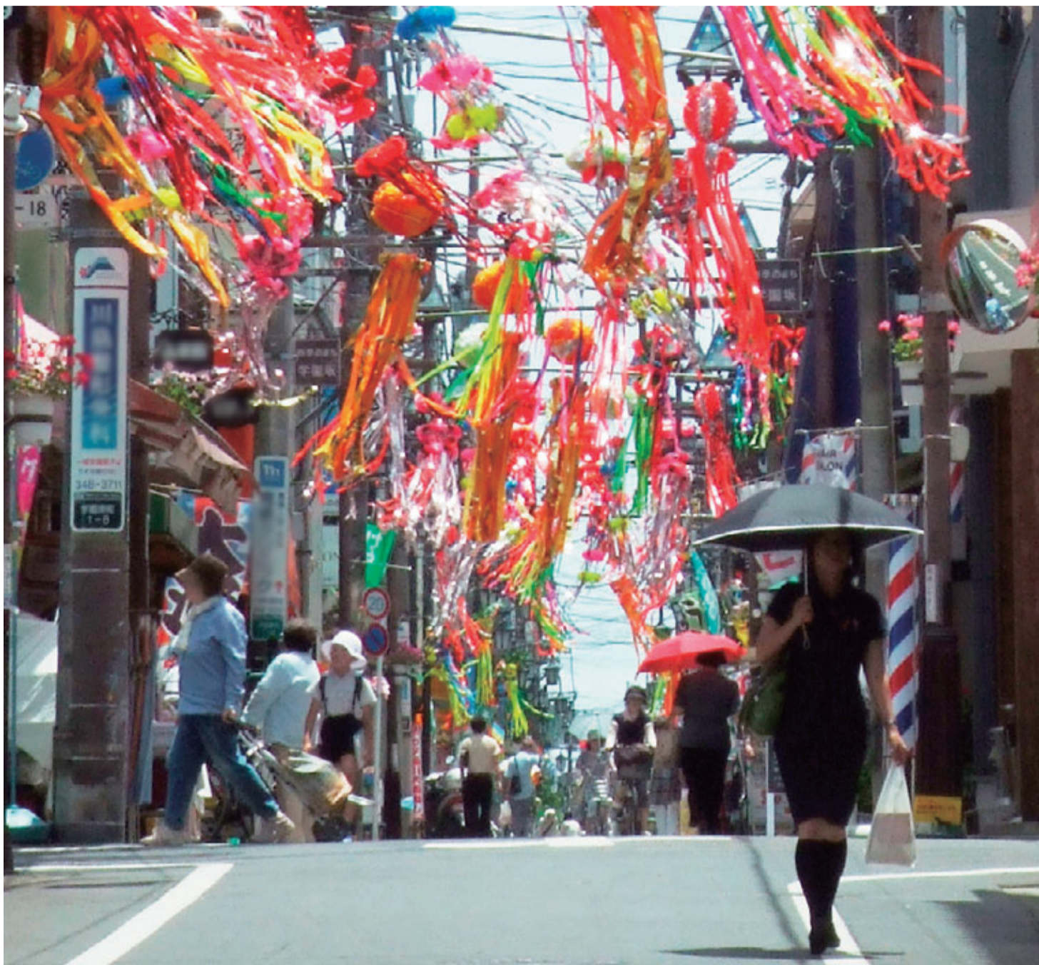
色鮮やかな七夕飾り(学園坂商店街)