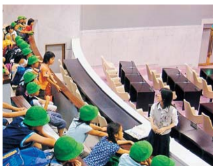
《小学3年生》 ○7月5日 鈴木小40人

本会議と委員会とはどちらも傍聴することができます。議場の傍聴席は60席で、会議当日の午前8時30分から市役所7階南側の議会事務局で受け付けをしています。(先着順) 定例会は、3月、6月、9月、12月の年4回開催しており、開