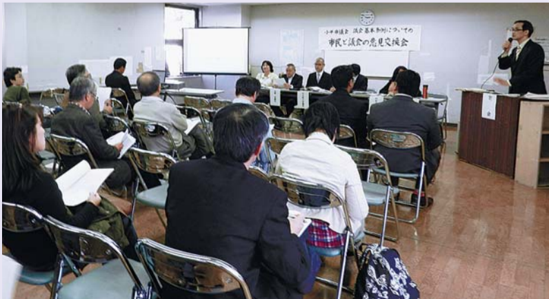
意見交換会の様子(平成25年11月16日 会場:学園西町地域センター)