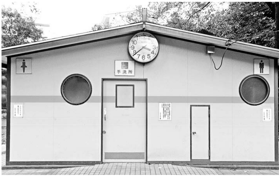
ベビーチェア等の設置が予定されている、小平グリーンロードに隣接する公園のだけでもトイレ