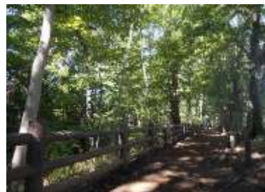
小平グリーンロード

みどりの適切な管理・更新を行い、小平市全体の水と緑のネットワークの形成を推進することで、小平市を代表するみどりとして、市内外から多くの利用者の増加が見込めるほか、野生生物の生息空間が確保され、生物多様性の保全にもつながります。