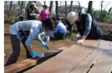
活動するアダプト団体

市民によるみどりの保全活動の推進、市民のみどりについての理解の向上が期待できます。