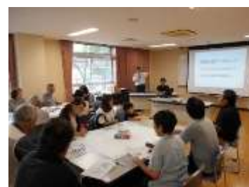
鎌倉公園ワークショップ

都市計画公園を整備することで、良好な都市環境が形成され、公園の活用機会が増加するほか、オープンスペース等の確保による防災面の強化などが期待できます。