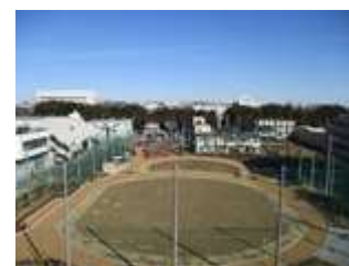
リサイクルセンター広場

施設利用者がみどりにふれる機会が増えることや、市が率先して公共施設の緑化に取り組むことで、事業者等への緑化の取組の拡大が期待できます。