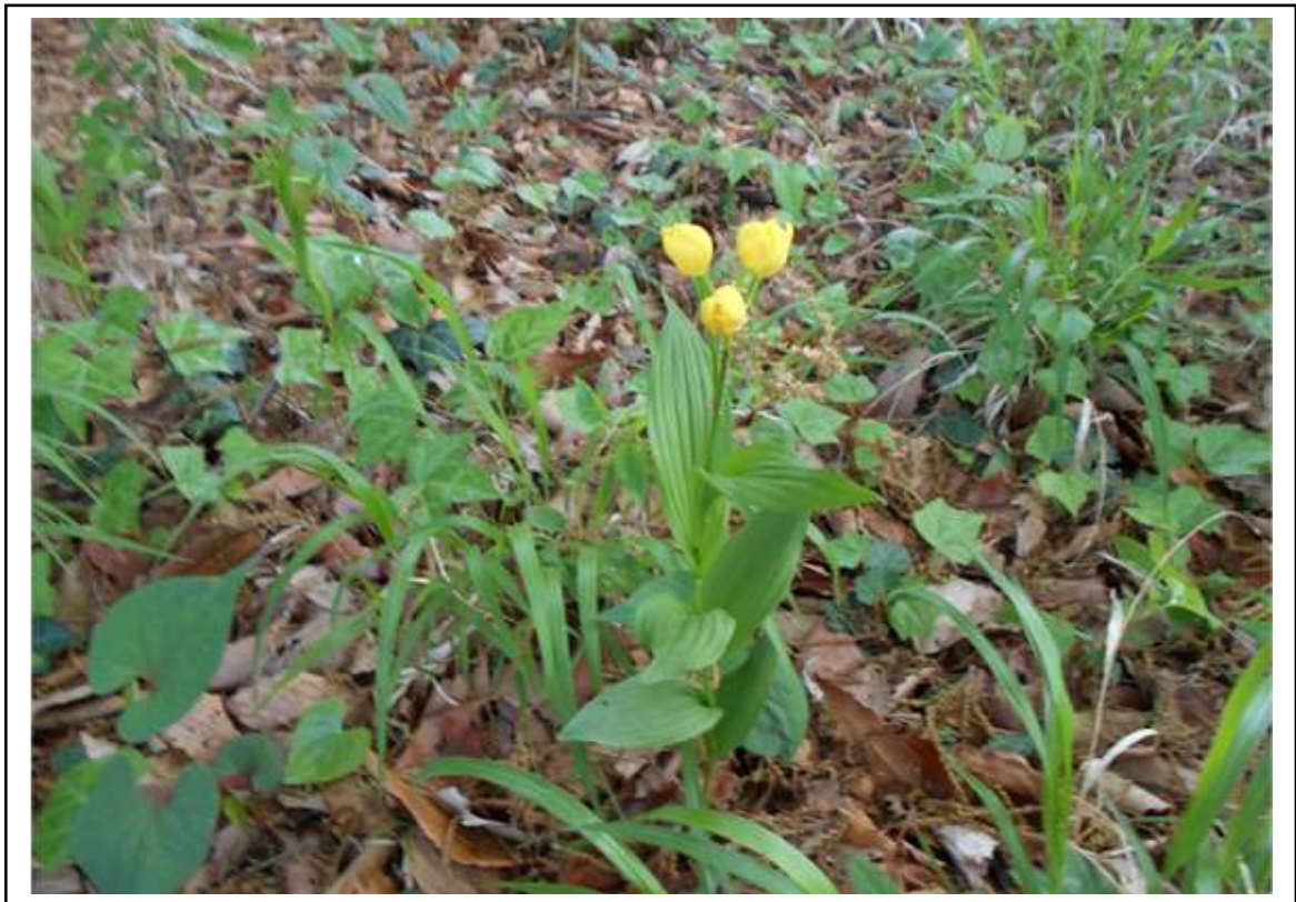
小川町1丁目特別緑地保全地区のキンラン