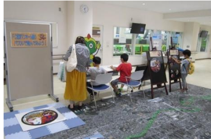
下水道に関する体験プログラムの様子