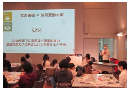
環境学習講座等の様子