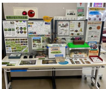
生物多様性の普及啓発等に関する展示

ふれあい下水道館では下水道のほか、環境普及啓発の一環として、環境に関する取り組みの展示を行いました。