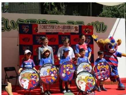
会場の様子（FC 東京コラボ新マンホール蓋お披露目式）