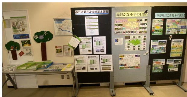
外来種対策等に関する展示