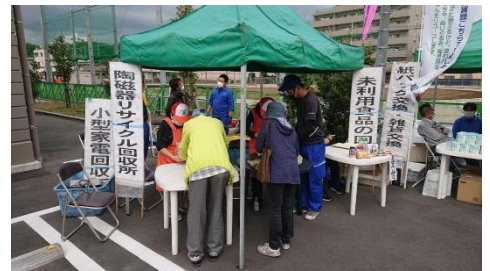
リサイクルきゃらばんの様子