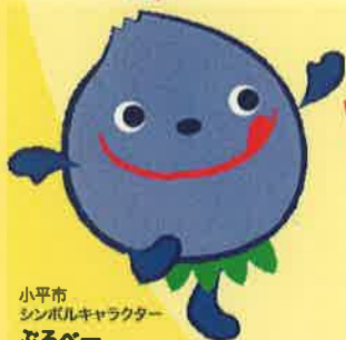
小平市 シンボルキャラクター ぶるべー