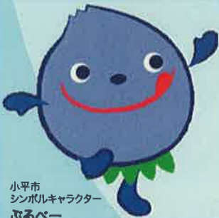
小平市 シンボルキャラクター ぶるべー