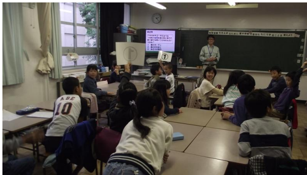
クイズは大盛り上がりです。班の中でも意見が割れ、じゃんけんで決めるなどの場面もありました。

②地球全体の平均気温が少しずつ上がっている現象である「地球温暖化」問題によって、世界各地ではさまざまな影響がでていること、地球温暖化は私たちの暮らしと密接に関係していることをスライドを見ながら学習しました。