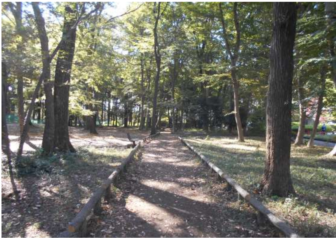
中央公園東側の樹林帯