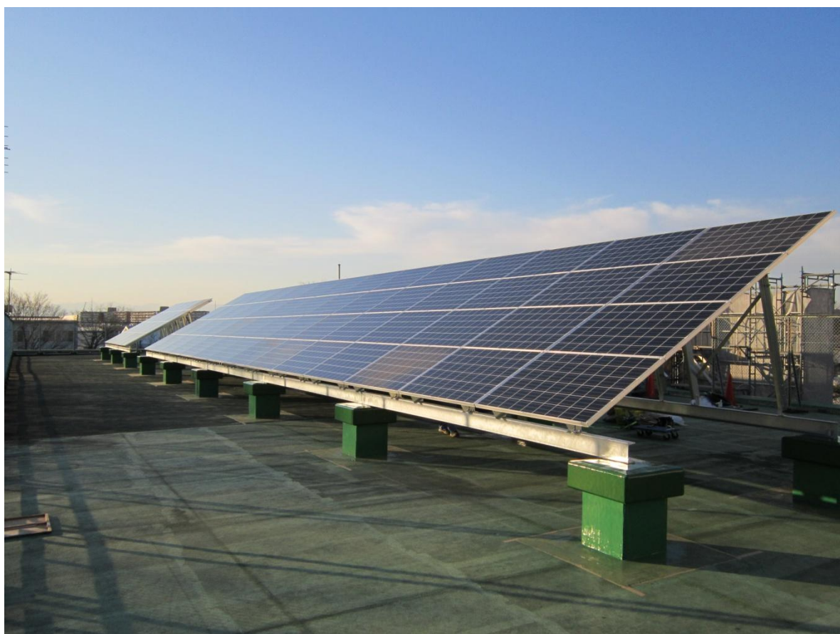
小平元気村おがわ東(平成25年度設置)