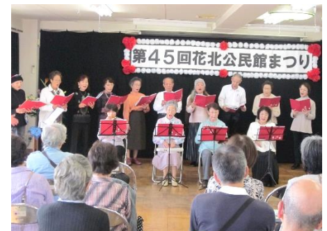
花小金井北公民館