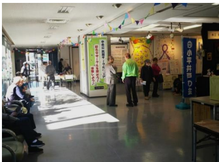
中央公民館 サークルフェア