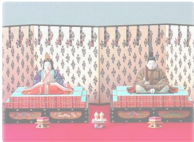
《内裏びな》(木彫彩色 昭和10年ごろ)