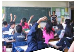
考えて表現する学習活動 「自分の考えをもち表現する児童の育成」をテーマに校内研究を進めています