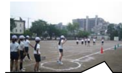
スポーツテスト 3年生以上が毎年行い、体力づくりにかかっています。