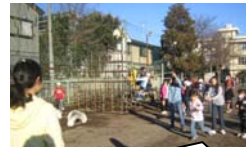
にこにこタイム きょうだい学年の交流活動です。