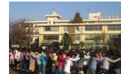
全校集会 集会委員会の計画で朝の時間に行われます。