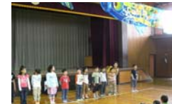
若草学級との交流活動 給食や生活科・社会科見学も一緒にいきます。