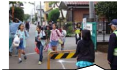
あいさつ運動 毎朝、児童が正門に立ってあいさつしています。