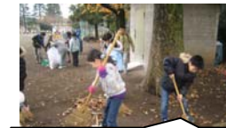
落ち葉はき 朝や放課後の時間に、自主的な活動として行いました。