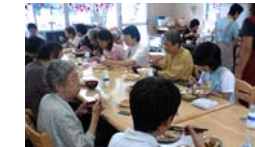
高齢者との交流給食 併設されている高齢者交流室で昼食と一緒に食べます。