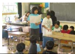
ヤゴ救出大作戦 トンボの幼虫(やご)をプールから救出し、児童がトンボまで育てます。