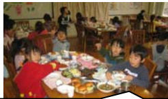
食育・健康づくり パイキング給食です。