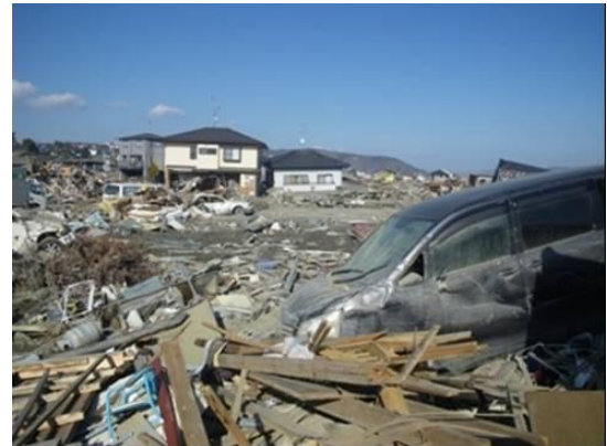
宮城県石巻市(4月16日(土))