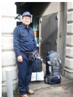
←被災地支援に向かう職員