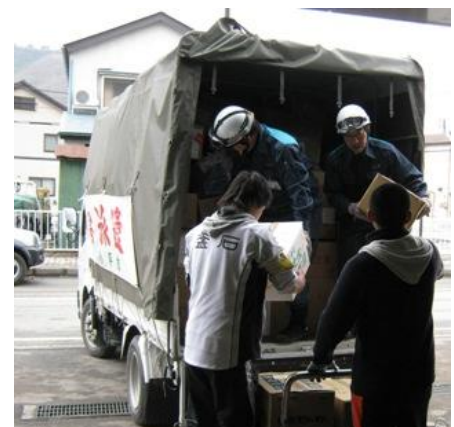
岩手県釜石市での救援物資受け渡し

3月25日(金)には、東京都が防衛省と協力して実施する被災地への救援物資輸送に際して、市備蓄のアルファ米4,000食を、集積地である陸上自衛隊練馬駐屯地に、市職員2名(防災安全課及び地域文化課の職員各1名)により搬送した。