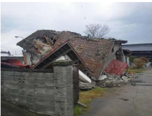
宮城県内陸部(4月16日(土))