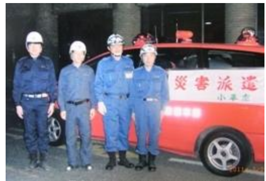
岩手県釜石市への物資搬送に出発する職員

3月20日(日)11時頃、岩手県釜石市と連絡がとれ、現地で不足している物資(津波で自宅が被災し、着替えもなく業務に当たっている釜石市の職員用の下着や靴下、作業服、防寒具、長靴、リュックサック等)につき、急きょ市職員、市議会議員、消防団員、ボーイスカウト有志に対して物資の提供を呼び掛け、同日17時過ぎまでに1.5tトラック(有限会社内山自動車工業から無償貸与いただいた物)及び消防団指揮車に満載する程度の量が集まり、市職員4名(市民生活部理事並びに防災安全課、ごみ減量対策課及び会計課の職員各1名)で21時に市庁舎を出発し、翌21日(月・祝)に釜石市災害対策本部へ引き渡した。