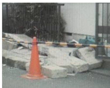
地震によるブロック塀の倒壊 (小平市北部)