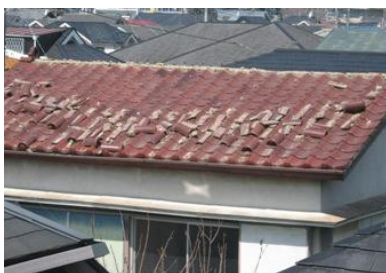
地震による屋根瓦の破損 (小平市中部)

※上記のほか、市庁舎における天井ボードの落下、市立学校におけるガラスの破損等、市施設における被害が生じている。