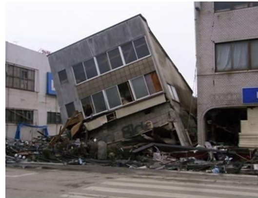
岩手県釜石市(3月21日(月・祝))