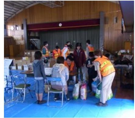
小平元気村おがわ東での救援物資受付

3月20日(日)～同月27日(日)に、小平元気村おがわ東にて救援物資の受付を行った。これは、東京都が行う物資救援を活用し、市で受け付けた救援物資を東京都を通じて被災地へ提供するものである。受付には市職員(災対健康福祉部のほか、節電協力のため閉館した公民館、図書館及び地域センターの職員等)のほか、延べ69人のボランティア(市民活動支援センターあすぴあ、ボーイスカウト、小平南高等学校女子バスケットボール部等)の応援を受け、599件、段ボール458箱分の物資を受け付けた。物資は、個人からの物のほか、自治会、保育園、小学校等で集められた物資が多く集まった。集まった物資は、3月28日(月)に東京都へ搬送した。