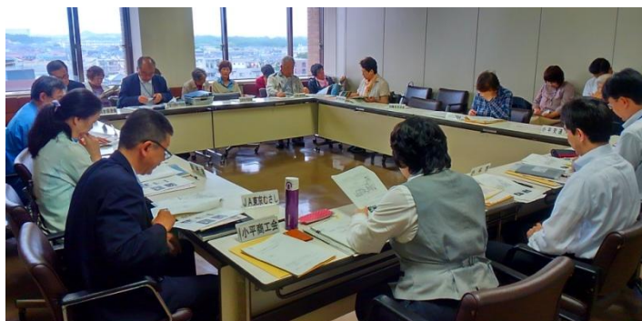
第1回小平南西部地域コミュニティタクシーを考える会(5月30日)

この度、市の南西部地域のコンパクトな生活交通を確立するため、「小平南西部地域コミュニティタクシーを考える会」を発足し、5月30日に第1回の会議を開催しました。今後は、月1回程度の会議において、移動における課題や需要を整理しながら、ルートや運行システムについての検討を行います。