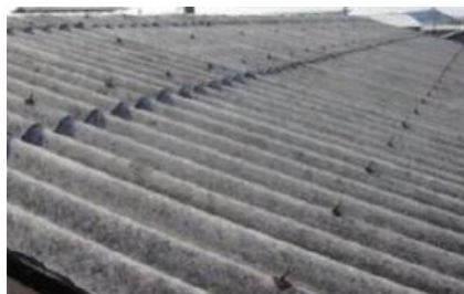
アスベスト含有スレート（波板）