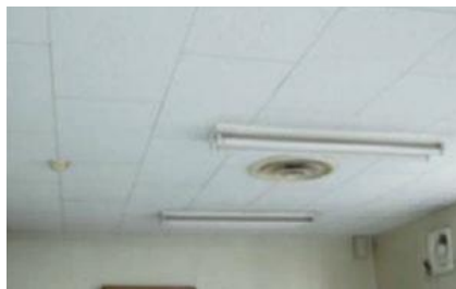
アスベスト含有化粧ボード（天井）