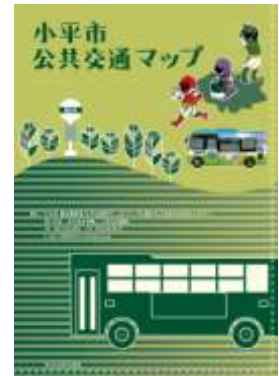
公共交通マップ表紙

転入者は外出手段が定着する前であり、公共交通マップを配布することで公共交通利用習慣のきっかけづくりをすることができる。また、自家用車で外出が多い市民に対しても、総合的な公共交通網の情報提供により、公共交通利用への意識転換を図ることができる。