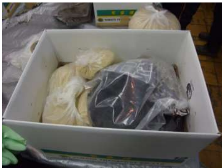
腐葉土の入ったダンボール