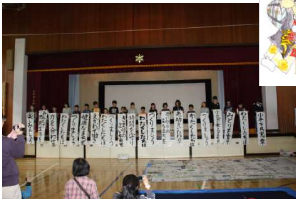
市内の小・中・高校生の作品発表の様子