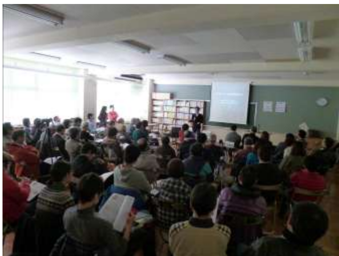
会場いっぱいの参加者の皆さん