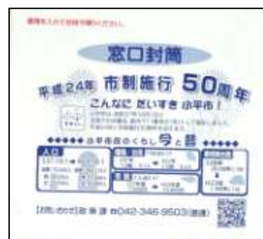
市民課、税務課等で窓口封筒として利用