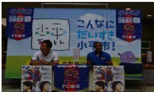
F C東京選手サイン会で使用 市民総合体育館

ロゴマークとキャッチコピーの統一デザインを用いた大型パネル（幅3m×高さ2m）を作成し、市役所本庁舎1階正面玄関横に展示し、来庁者へのPRを行った。また、持ち運びが可能であったことから、様々なイベント会場においても活用し、視覚的に市制施行50周年のPRを行った。