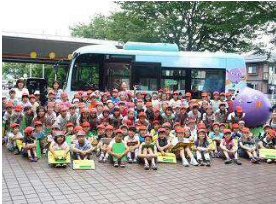
庁舎見学に来庁していた小平第五小学校3年生の皆さんと一緒に記念撮影

当日は、ラッピングバスのデザインにも採用されている「ぶるべー」も祝福にやって来ました！