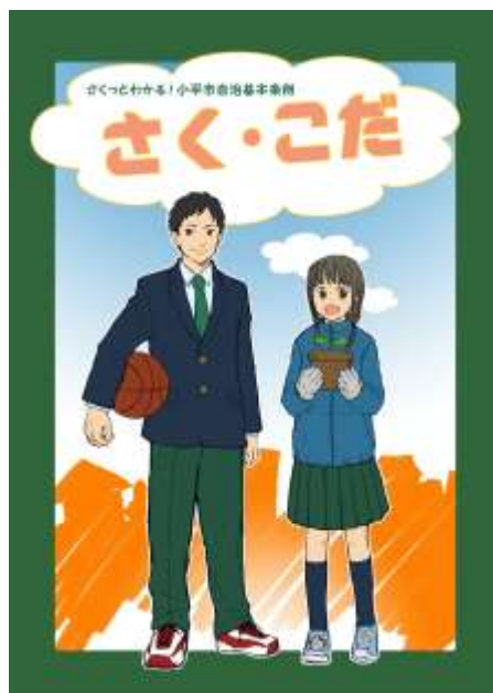
小平市自治基本条例の解説用小冊子 「さく・こだ さくっとわかる！小平市自治基本条例」