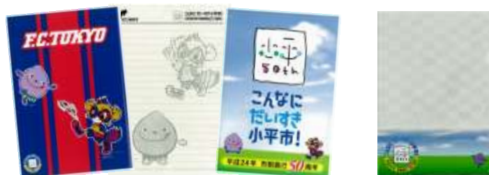
50周年記念限定グッズ（ノート、クリアファイル）