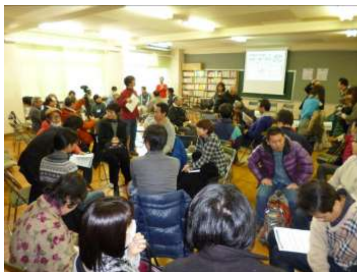
参加者同士でシンポジウムを振り返り、対話する様子