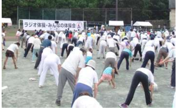
みんなで元気にラジオ体操