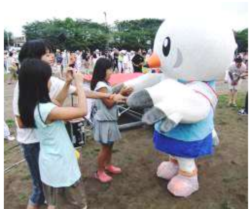
子どもたちと握手