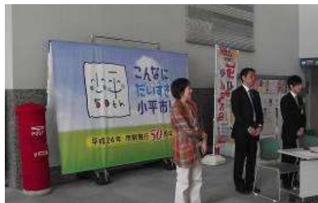
憲法週間行事の受付で使用 ルネこだいら