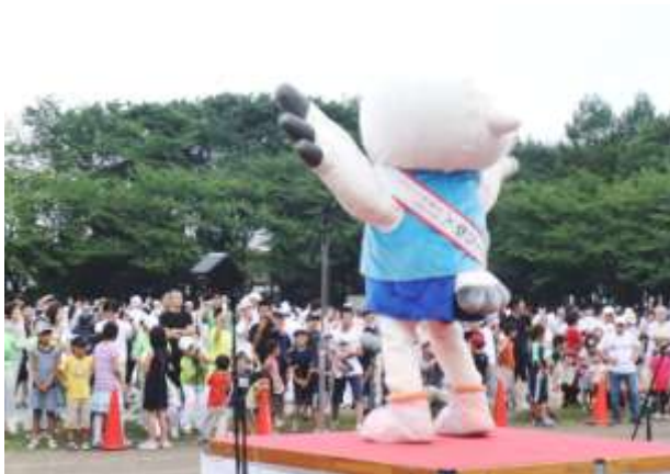
ゆりーとダンスの披露