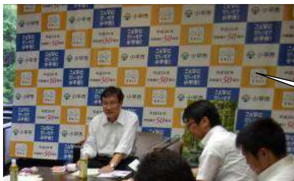
50周年記念仕様のバックボード

このほか、NHK「BS日本のうた」(7月19日市民文化会館)や「夏期巡回ラジオ体操・みんなの体操会」(8月31日中央公園グラウンド)の公開収録に際して、イベントへの市民の参加の呼びかけとともに市制施行50周年の対外的なPRを行った。