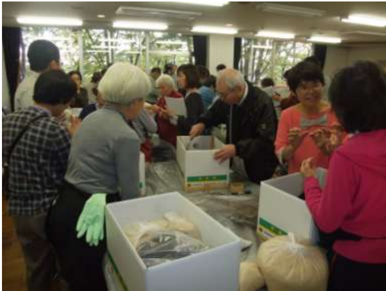
ダンボールコンポスト講習会の様子