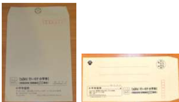
市民等への事務用封筒として利用