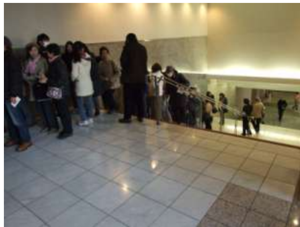
入場前の大行列の様子