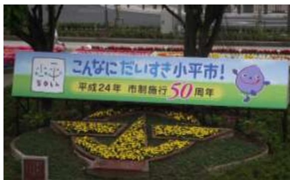
市制施行50周年PR用の大型看板を設置