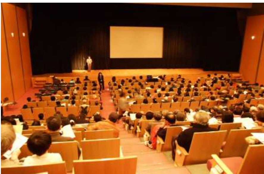
会場（ルネこだいら 中ホール）は満員御礼！