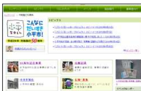
50周年ホームページ

平成23年11月に市ホームページ内に、50周年のページを開設し、市長のメッセージをはじめ、記念事業やイベントの内容、日程を知らせる「記念事業」コーナー、事業の進捗状況、活動の様子を記録した「活動記録」コーナー、小平市の概要や簡単な歴史、昔の写真を掲載した「小平を知る」コーナー、市からのメッセージおよびイベントなどへの参加者募集の「広報・募集」コーナーを設け、事業の進捗に応じて、各ページのコンテンツを充実させた。