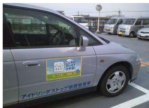
公用車やごみ収集車に貼付した50周年PR用マグネット