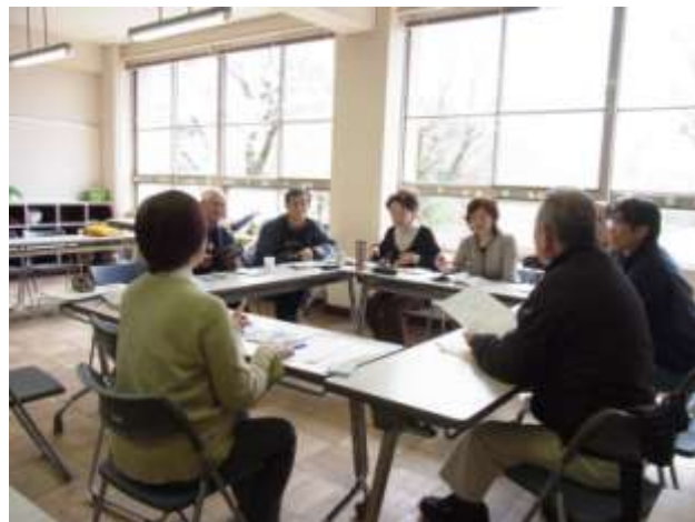
「小平市自治基本条例市民の集い」メンバーによる白熱した会議の様子