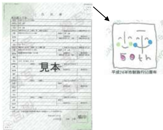
ログマーク入り住民票

住民票、印鑑登録証明書、課税証明書などの各種証明書に、ログマークを入れて、平成23年11月から約1年間、数量限定で発行した。