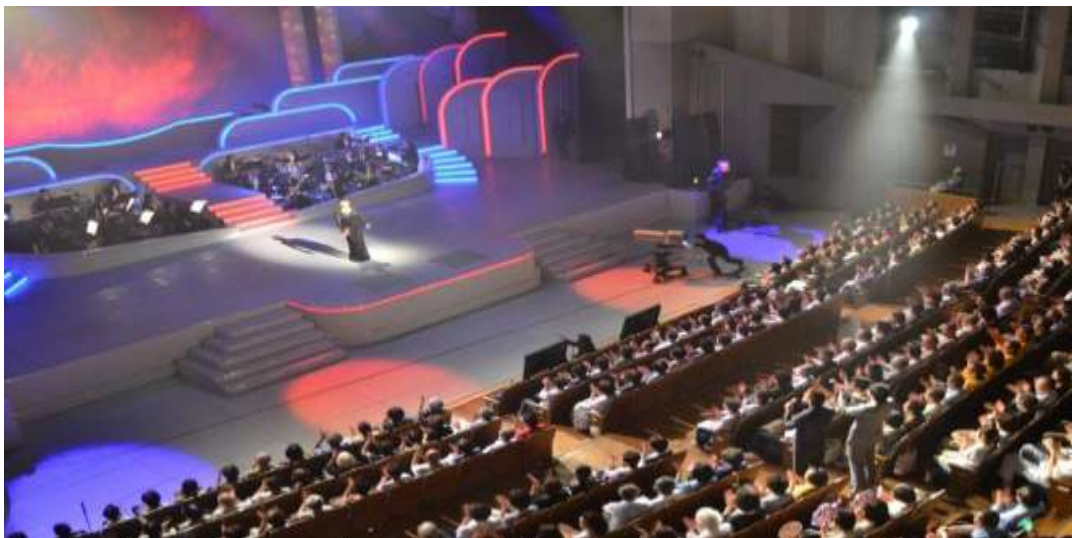
満員の観覧席（ルネこだいら大ホール）

市川由紀乃、キム・ヨンジャ、 香西かおり、小金沢昇司、 中村美律子、西尾夕紀、 藤原浩、三山ひろし、 森昌子、山川豊、和田アキ子、 渡辺真知子