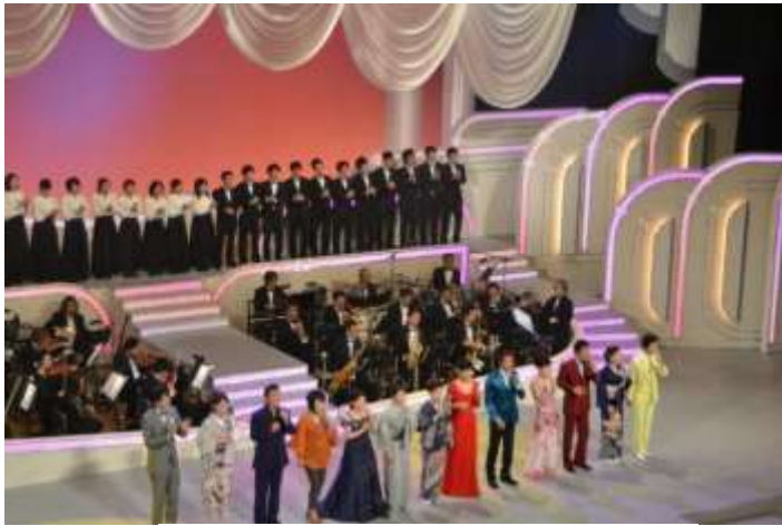
出演者勢揃いのオープニング