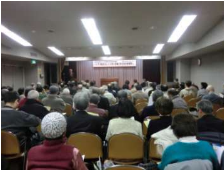
会場（中央公民館 ホール）の様子