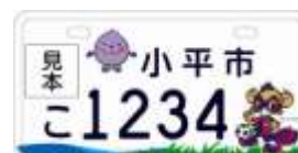
ぶるべーと東京ドロンパ入りのご当地ナンバープレート