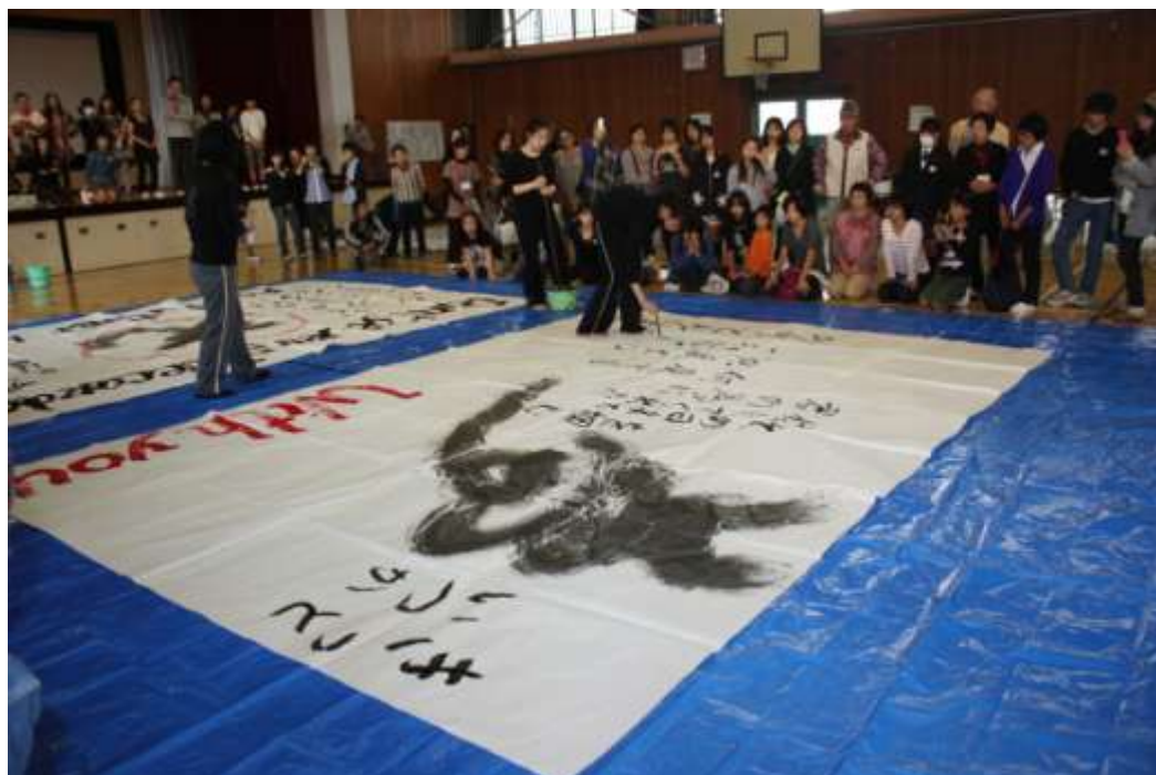
たくさんの人の思いが詰まった大きな「夢」