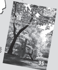
ひらく 35号 11月発行