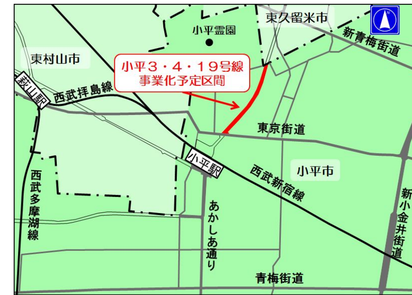
【 位置図 】