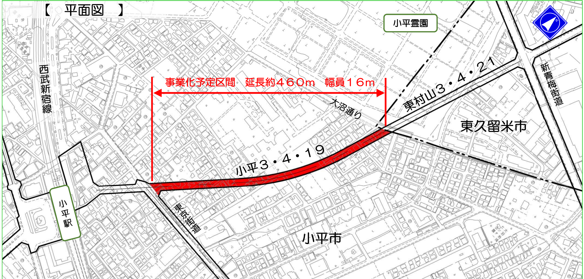
【 平面図 】