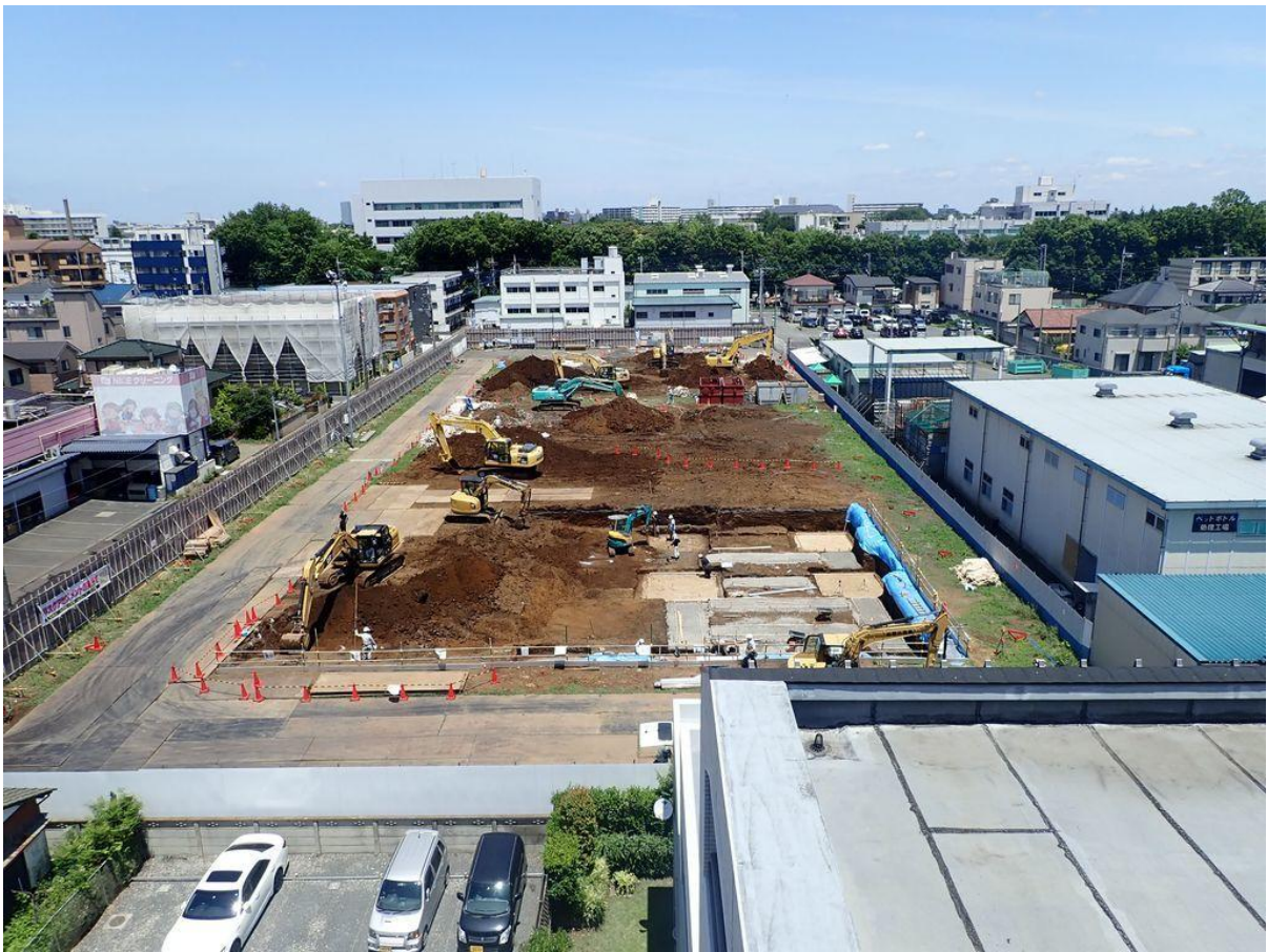
・基礎、土工事（平成30年8月3日時点）