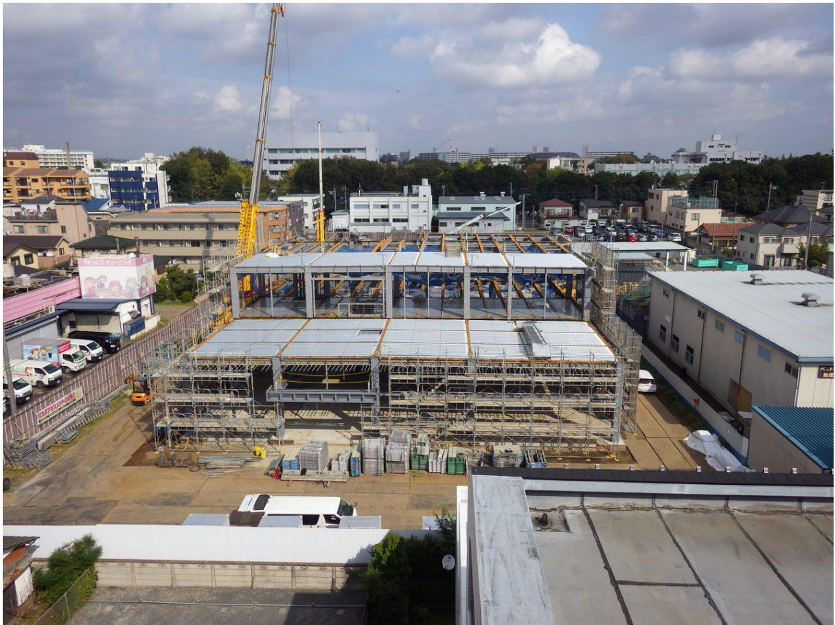
・鉄骨・外壁工事（平成30年11月24日時点）