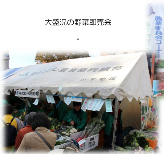
大盛況の野菜即売会