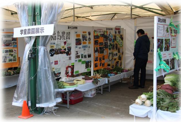
市内19小学校による学童農園の展示

来場者や生産者に産業まつりの感想を聞いてみると、「市内では高品質で多種多様な農産物が生産されているのを改めて知った。今後も楽しみにしている。」「次世代を担う子どもたちに実体験を通じた教育がされているのが素晴らしいと思った。」「産業まつりを通して小平農業を数多くの人にPRしていきたい。」「都市農業の応援になってほしい。」「などの意見を頂きました。