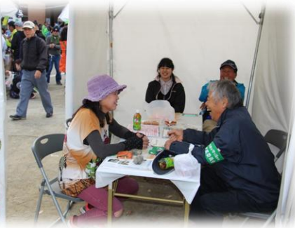
農産物育て方相談会の様子