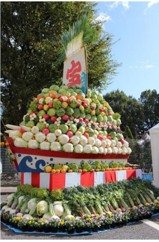
小平市野菜組合製作による宝船

会場では、宝船の展示、市内生産者による農産物の品評会、野菜・植木・花の即売会、市内小学校による学童農園の展示、各種団体による模擬店があり、中でも即売会場は秋の長雨や台風などで野菜の価格が高騰したこともあり、大変にぎわいをみせていました。また、小平市内全小学校による学童農園の展示ブースでは、農作業体験の写真や研究発表、子どもたちが育てた野菜の展示がされており、生き生きとした表情を見ることができました。