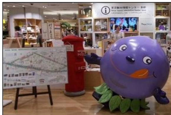
小平伝統文化「灯ろうワークショップ」の様子