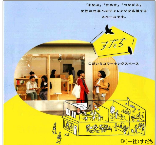
こだいらコワーキングスペース「すだち」