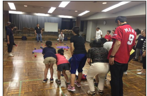
ボッチャ交流会の様子