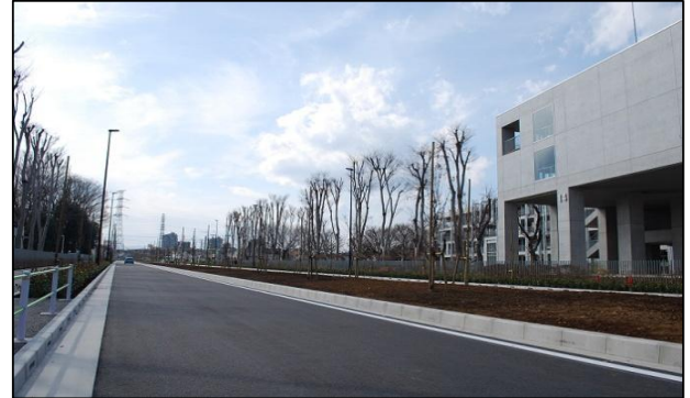
都市計画道路3・3・3号線(小川町一丁目区間)