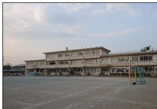
現在の第十一小学校