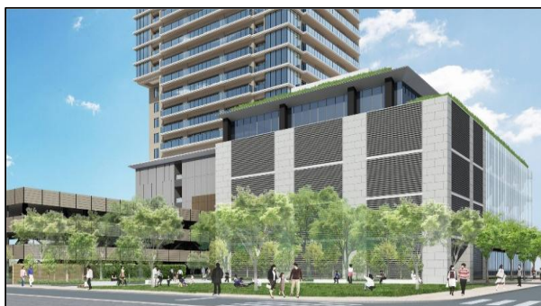
小川駅西口地区市街地再開発事業施設建築物外観イメージ図 （北西側からの眺め）