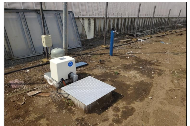
防災兼用農業用井戸