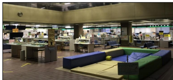
市役所1階窓口の様子