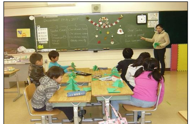
放課後子ども教室の英語教室の様子