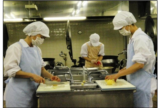
委託化された給食調理業務の様子