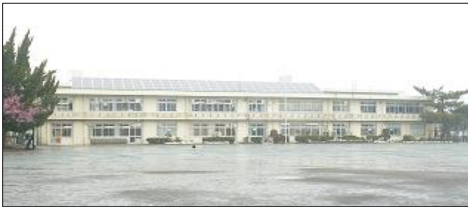
増築工事が予定されている第十二小学校