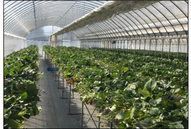
平成30年度に導入した施設や農業用設備等