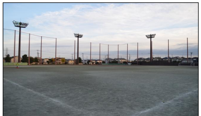
現在の小川西グラウンド