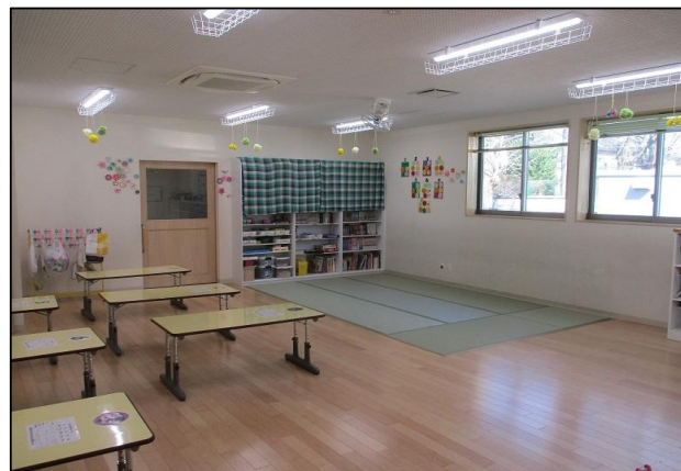
学童クラブ室の様子