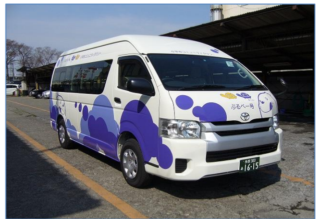
ぶるべー号（栄町ルート）