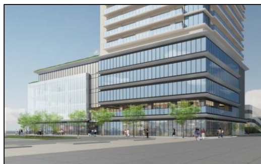
小川駅西口地区市街地再開発事業イメージ（南東側からの眺め）