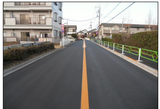
道路維持補修工事により整備された市道