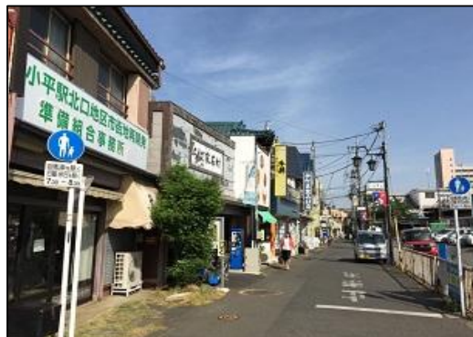
現在の小平駅北口