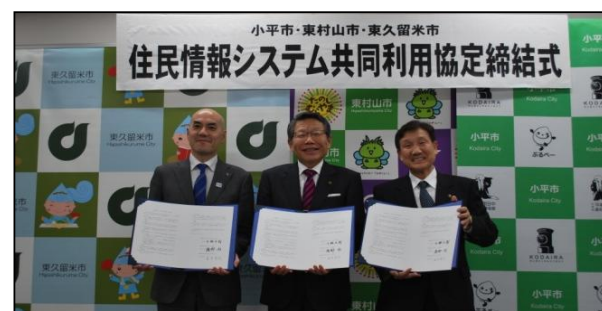
住民情報システム共同利用協定締結式