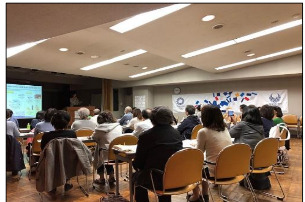
オリパラ気運醸成のための講演会の様子