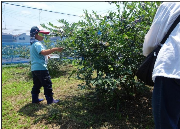
小平産農産物の収穫体験の様子