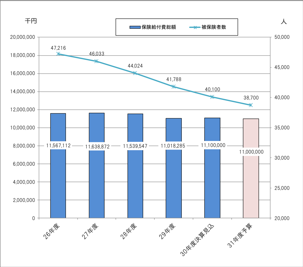
保険給付費総額と被保険者数の推移