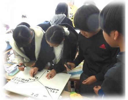
小平第七小学校 授業中の検討風景

意見募集の提出方法について、市立各小中学校でも提出ができるようにしました。小平第七小学校では6年生の授業で取り上げていただくなどご協力をいただき、合計で148件という多くのご意見をいただくことができました！