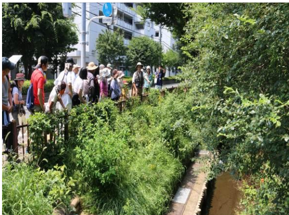
野火止用水の観察