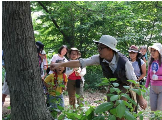
雑木林で昆虫観察