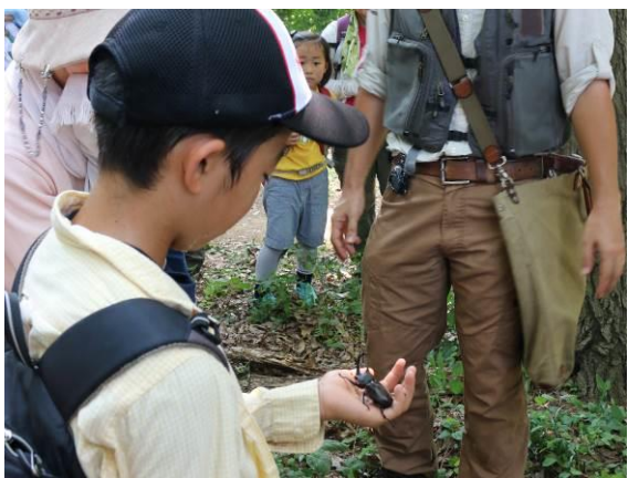
見つけたカブトムシをじっくり観察