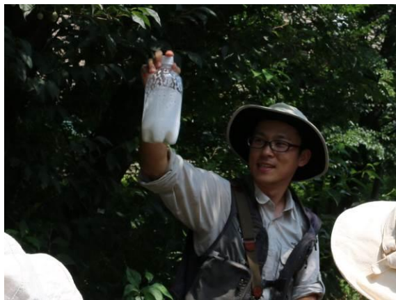
エゴノキの実で実験にチャレンジ