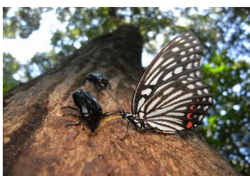
アカボシゴマダラ