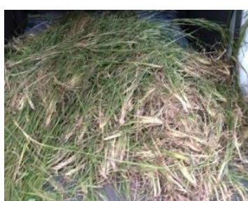
メリケンカルカヤ