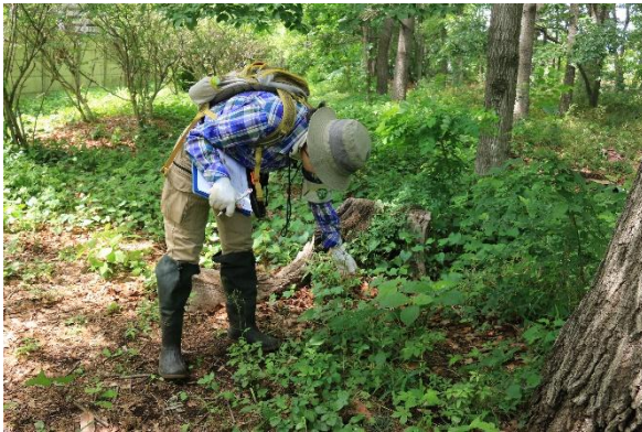
写真 1. 踏査による植物調査

踏査により目視調査を行った。ただし、鳥類については鳴き声での記録、昆虫類については捕虫網を使った捕獲（スウィーピング法など）での記録、水生生物についてはタモ網による捕獲での記録をそれぞれ行った。なお、植物と昆虫類については、詳細な同定を行う必要がある種について、最低限のサンプルを採取した。