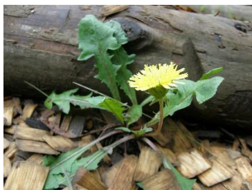
セイヨウタンポポ