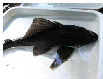
マダラロリカリア