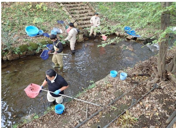
写真 3. タモ網等による水生生物調査