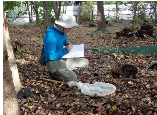
写真 2. 捕虫網を使用した昆虫調査