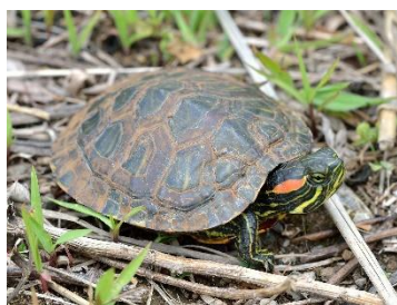
ミシシippアカミミガメ