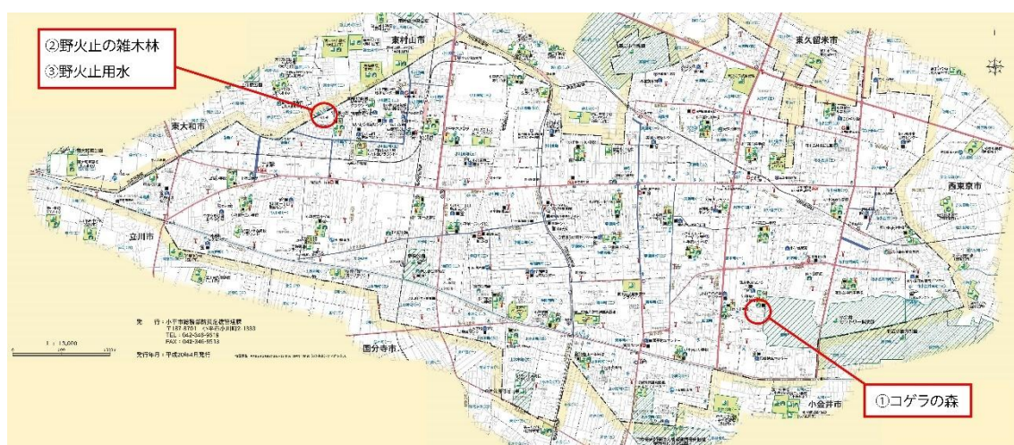
図1.調査地の位置