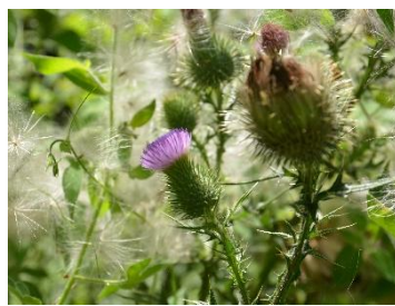
アメリカオニアザミ