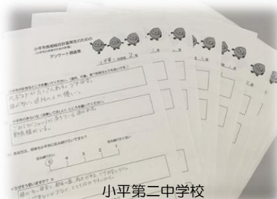
小平第二中学校 (アンケートにご協力いただきました)

未来を担う中学生の皆さんの意見をお聞きするため、各校数人ずつご協力をいただきました。