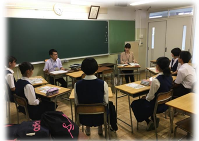
花小金井南中学校