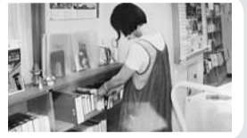
読み聞かせや図書室の整備などの図書活動支援