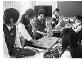
授業のアシスタント、実技の補助などの学習支援