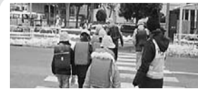
登下校や社会科見学・遠足などの見守り支援