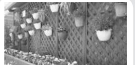
花壇の整備などの環境支援