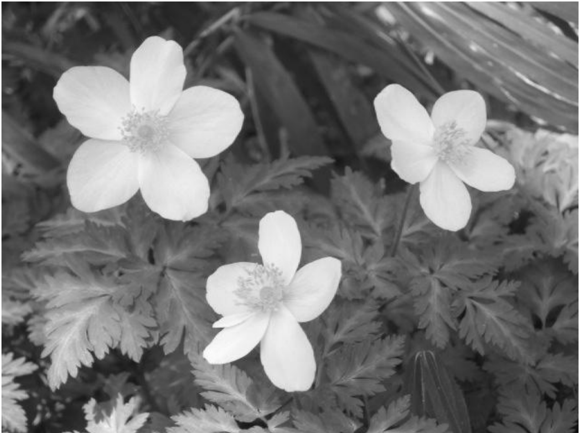
(雑木林に生息するイチリンソウ)