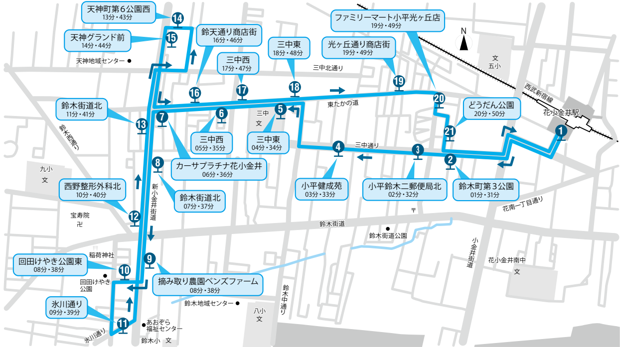
小平市コミュニティタクシー（鈴木町ルート）時刻表