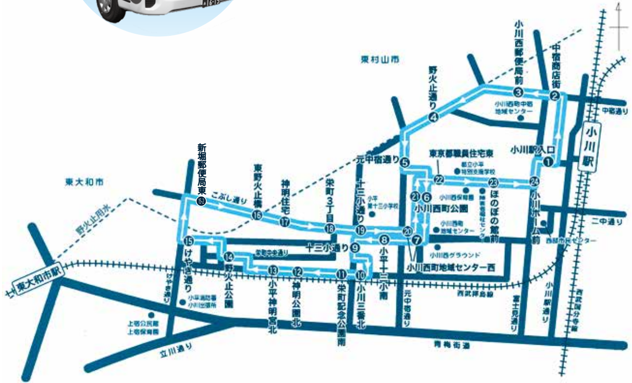
小平市コミュニティタクシー（栄町ルート）時刻表