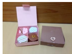
「バレンタインチョコ」