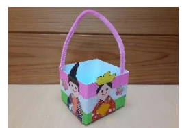
「おひなさまバック」