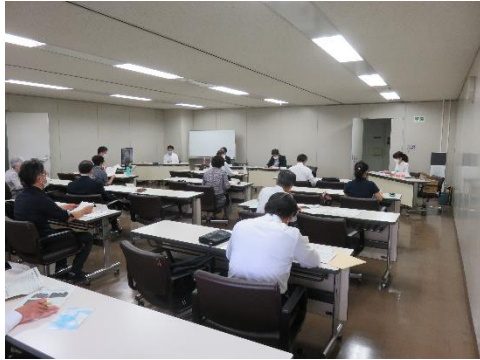
委員同士の間隔をあげスクール形式の座席配置、ウェブシステムで参加の委員2名と会場をモニターで中継するなど、新型コロナウイルス感染症拡大防止の対策を図りました。