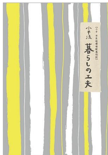
チャレンジ省エネ 2019 in こだいら チラシ