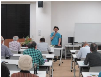
緑のカーテン講習会