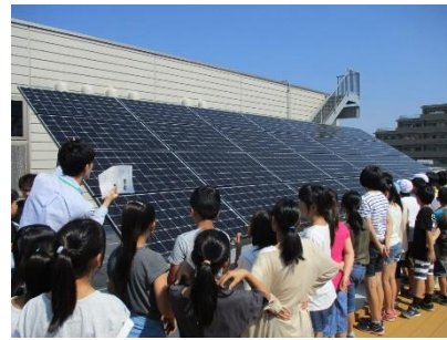
小平第六小学校出前授業