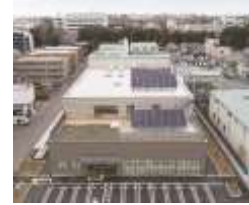
リサイクルセンター

主要設備：供給・搬送コンベヤ、破袋機・小袋破袋機、除袋機、磁選機、アルミ選別機、カンプレス機