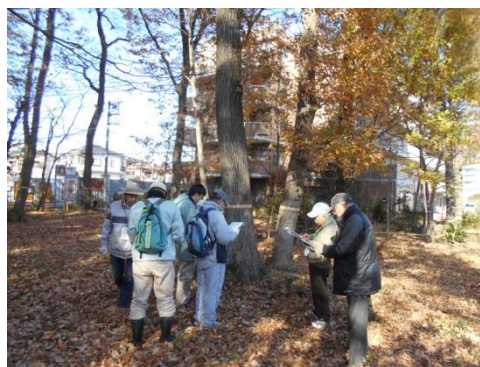
森のカルテづくり