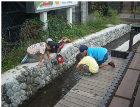
用水路の親水整備