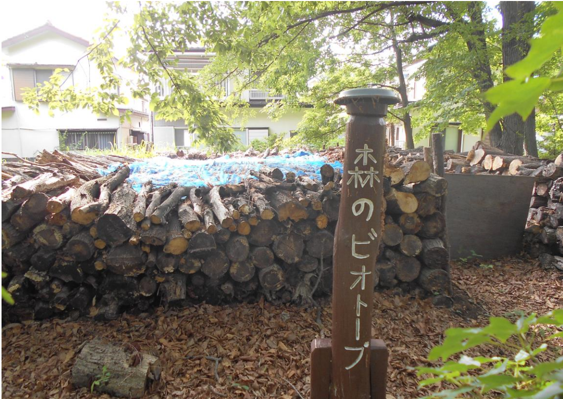
森のビオトープ（上水新町一丁目特別緑地保全地区内）