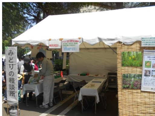
みどりわかるで所 (みどりの相談所)