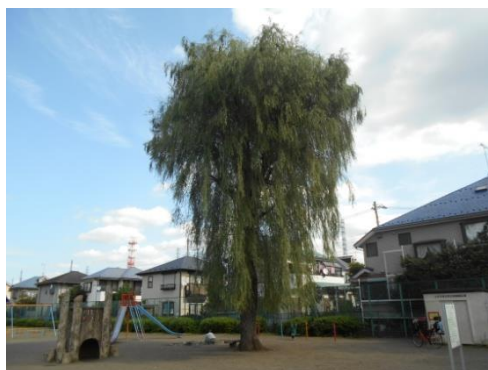
小川公園のシダレヤナギ（こだいら名木百選）