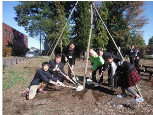
どんぐりの里親制度