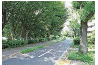
小平グリーンロード

小川東町出身。元バレーボール選手。現在はスポーツキャスターとして活躍。1985年に女子バレーボール全日本代表に選出され、ワールドカップで国際大会デビュー。ソウル、バルセロナ、アトランタの3回のオリンピックに出場。