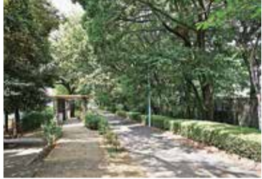
小平グリーンロード

仲町出身。女流棋士。12歳でプロ入り。2009年度には女流最多対局賞を受賞し、2011年には初タイトル「女王」を獲得した。2018年に女流四段に昇段。第2子の出産を挟みながらリーグ戦を全局戦った。