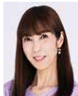
おおばやし もとこ 大林素子 さん

この度は、市制施行60周年おめでとうございます。 その歴史の中で、私も小平市のたくさんの緑と温かい人々に育てて頂きました。 宝塚歌劇団在団中も、時間を見つけては癒しを求めて実家によく帰ってきたことを覚えています。 そんな私のお気に入りスポットは、今も昔も玉川上水です。 朝の静かな時間や、夕方の神秘的な景色を見せてくれる時間に散歩をすると、いつも新しい気づきを与えてくれます。 玉川上水は、今までもこれからも私にとってはなくてはならない大切な場所です。