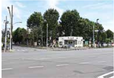
八坂駅付近の交差点

小川東町出身。俳優、声優、演出家、脚本家、ダンサーなど幅広く活躍。NHK Eテレ「みつけた」のオフロスキー役としても知られる。