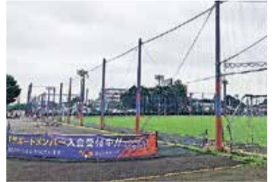
FC東京小平グランド

学園東町出身。元サッカー選手。ユース世代の日本代表に選出され、Jリーグでは、FC東京、FC岐阜、水戸ホーリーホック、アビスパ福岡、清水エスパルスに所属。2020年12月に現役を引退。