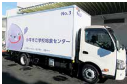
ぶるべーをデザインした 配送トラック

また、保温・保冷性の高いステンレス食缶で、温かいものは温かく、冷たいものは冷たいまま教室まで届けます。