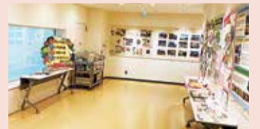
展示・見学ホール

調理の紹介や食育展示、調理室を窓越しに見学できる見学ホールを設置し、学校給食について学ぶことができる食育の発信拠点として活用していきます。