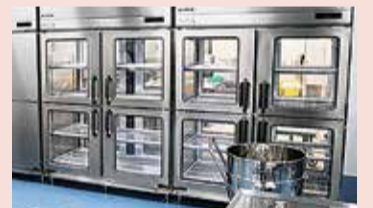
食材のみ部屋移動できる冷蔵庫

食材の搬入、肉や魚の下処理、調理する部屋などを明確に分けて、衛生管理を徹底しています。また、給食を提供する中で、人や食材の交差による間違いなどを防ぐため、食材が一方の動線になるように各部屋を配置しています。