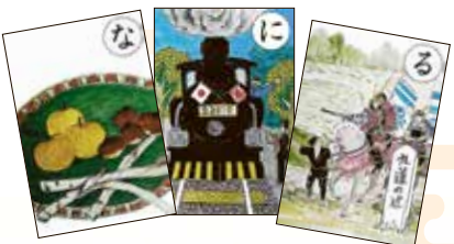
小平市郷土かるた

鈴木遺跡や喜平橋など、小平市の文化や歴史などが題材となったかるたです。かるたで遊びながら、身近にある文化財を知り、歴史を振り返ってみませんか。