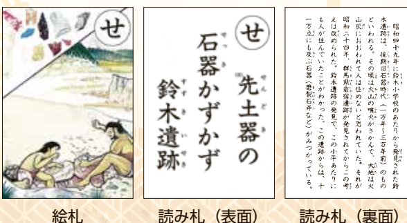
絵札 読み札（表面） 読み札（裏面）

小平市郷土かるたは、昭和57年に郷土史研究の公民館活動がきっかけとなり、小平市郷土かるたをつくる会が中心となって製作されました。読み札の文は、市民からの公募を経て、裏面の解説文とともに編集しました。絵札は小平市美術協会が描き、すべて市民の手づくりで完成しました。