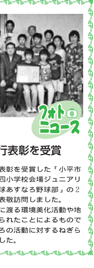
市内の2団体が 青少年善行表彰を受賞

市内の2団体が 青少年善行表彰を受賞 日本善行会の善行表彰を受賞した「小平市ラジオ体操会連盟第十四小学校会場ジュニアリーダーの会」、「少年野球あすなろ野球部」の2団体の皆さんが市長を表敬訪問しました。今回の表彰は、長年に渡る環境美化活動や地域への貢献活動が認められたことによるものです。市長からは、日ごろの活動に対するねぎらいの言葉がかけられました。