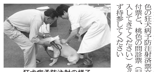
狂犬病予防注射の様子

狂犬病予防注射 平成23年度の狂犬病予防定期集合注射の屋外会場を開設します(右下表参照)。※屋外会場を利用できるのは、小平市に登録されている犬のみです。※雨天の場合中止することがあります(右下表参照)。費用 3千5百50円(注射料)