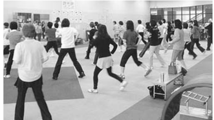
ハッスルエアロの様子

◆紙芝居を楽しもう 5月5日(木・祝)と5月12日(火)の2回、紙芝居を楽しもう。5月5日(木・祝)と5月12日(火)の2回、紙芝居を楽しもう。