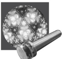
ダブルチェンバー スコープ

以上の作品を展示します。万華鏡を手にとり、次々と繰り出される色彩豊かな世界をご覧ください。