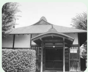
旧小平小川郵便局舎

小平ふるさと村の入り口にあり、そのシンボルともされる旧小平小川郵便局舎は、もともと現在の小平第一小学校のあたりにあった妙法寺という寺院の境内に、明治41年(1908年)に建てられました。屋根の3か所に見られるトタン板製の鬼板(鬼瓦に当たるもの)には、当時の管轄省庁であった、逓信省の頭文字「テ」をかたどったマークがデザインされています。家人が座敷を通らずにトイレに行くための細い廊下や、美しい染付の施された大小便器などは、目につきにくい点ですが、局長の私宅を兼ねた郵便局という性格を物語るものです。