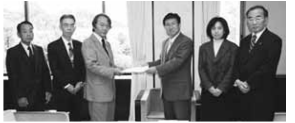
検討委員会から報告書が提出(平成18年10月24日)

小平市行財政再構築プラン(再構築プラン)が、4月からスタートします。市では、平成18年度に設