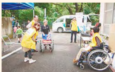
バイユアセルフ体験