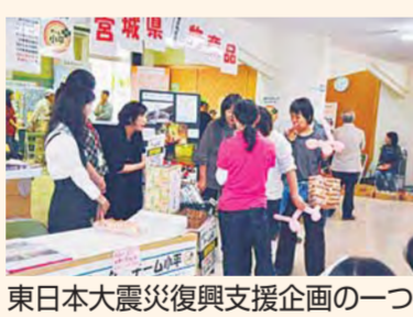
東日本大震災復興支援企画の一つ

あすぴあでは、市民参加でさまざまな事業を行っています。イベント部会、フェスタ部会、広報部会の3つの部会があります。いつでも部会員を募集していますので、どうぞお越しください。