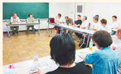
東日本大震災の救援活動についての語り合い

活動団体の交流を目的に、毎回テーマを挙げて年4回開催します。参加した団体・市民が語り合い、知り合う場所です。今後は、国際交流関係団体やシニア関連団体の交流会を予定しています。