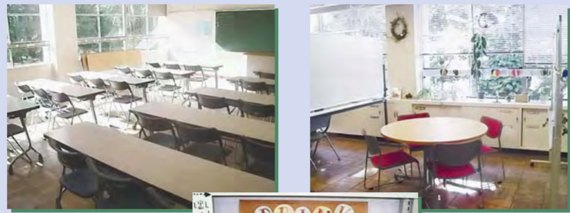
あすぴあ会議室 (インターネット環境あり) 交流スペース セルフサービスのドリンクコーナー

小平市民活動支援センターあすぴあは、旧小川東小学校の跡にできた複合施設「小平元気村おがわ東」の2階にあります。誰でも使える交流スペース、団体登録をすると利用できる会議室や印刷室があります。ぜひ、一度足を運んでみませんか。詳しくは、あすぴあのホームページをご覧ください。お問い合わせください。