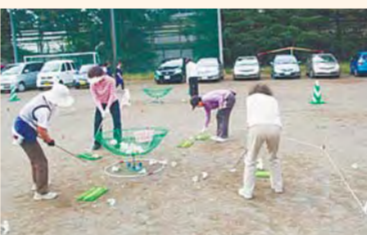
ターゲットボードゴルフ