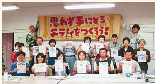
広報講座でのチラシ作り