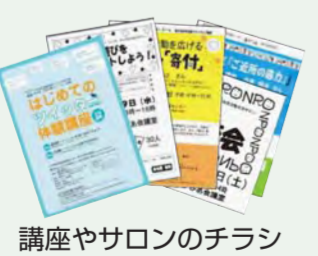
講座やサロンのチラシ

年4回発行し、あすぴあ主催事業の様子、希望する登録団体の取材記事や市民活動支援公募事業、いきいき協働事業の記事などを載せています。平成23年度は、臨時号としてNPOフェスタ特別号を作りました。