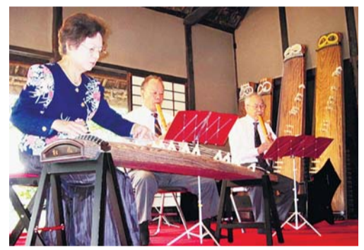
和楽器による演奏会

◆和楽器による演奏会 小平市三曲協会による演奏をお楽しみください。 とき 10月6日(土) 午後2時～3時 費用 無料