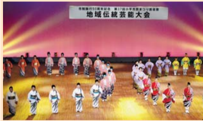
新こだいら音頭初披露