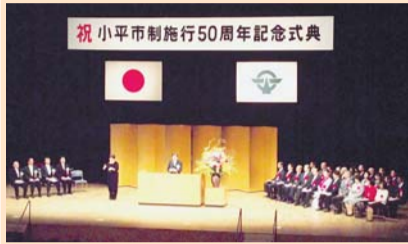
市制施行50周年記念式典