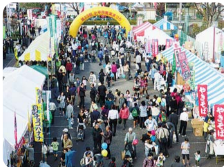
昨年の産業まつりの様子