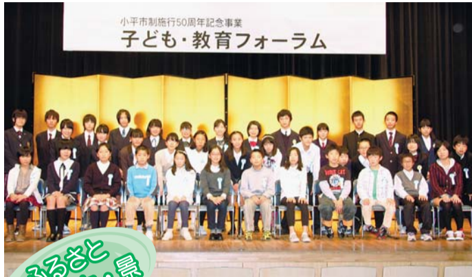
小平市制施行50周年記念事業 子ども・教育フォーラム

◇小平市ホームページ http://www.city.kodaira.tokyo.jp ◇電子メール info@city.kodaira.lg.jp ◇小平市携帯電話用ホームページ http://www.city.kodaira.tokyo.jp/m/