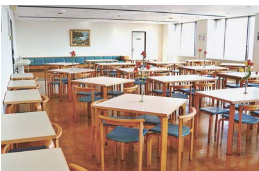
改修を終えた市役所6階食堂

市役所6階食堂の厨房床面などの改修工事期間中は、大変ご迷惑をおかけしました。再開する食堂では新たに自動券売機を導入し、食券を購入していただくようになります。また、一人でも気軽に食堂を利用できるようにと専用のテーブル席も12席