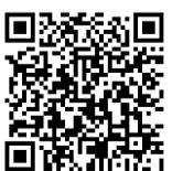
東京都光化学スモッグ情報のQRコード

今夏は例年以上に光化学スモッグが発生することが予想されます。注意報や学校情報は、東京都環境局のホームページ (http://www.ox.kankyo.metro.tokyo.jp) または、右図のQRコードから携帯電話のメールアドレスを登録することができます。なお、地域選択は「多摩北部」です。 問合せ 環境保全課 ☎042(346)95036