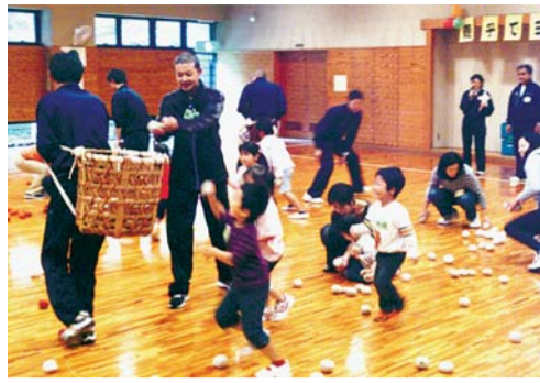
追っかけ玉入れの様子

とき 10月26日(土) 午前10時 30分〜正午 午前10時20分集合 ところ 市民総合体育館 費用 無料 対象 市内在住・在勤の親と3歳以上の未就学児 定員 20組