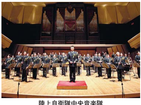
陸上自衛隊中央音楽隊

※当選者には、入場券の引き換え方法を明記のうえ返信しますので、試合当日、会場内の指定場所で、返信はがきと引き換えしてください。 問合せ FC東京「AJINOMOTO Day」親子観戦ご招待 小平市係 ☎135-0003 江東区猿江2-15-10 ☎03(36635)8960 (月曜・金曜日の午前9時30分〜午後5時)